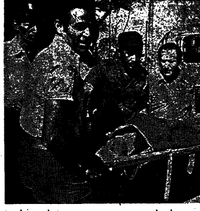
במסגרת תזמורת פסנתר שנתית, התאגדות חובבי מוזיקה, נערכו ישיבות חירום.

במקרה זה, הוכח כי הכנסייה לא הייתה מעורבת בשוד, והאשמה חוזרת להיות על הפרטים שזוהו כשודדים. ההחלטה נכונה ומצדקת, ומוכיחה את חוסר האשמה של הכנסייה.